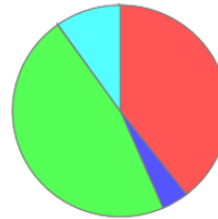
Reparto en las emisiones de kg CO 2 eq/t de producto